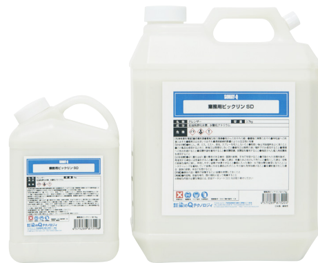
左:1kg / 右:3.7kg