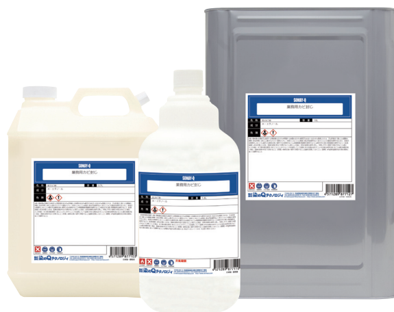
左: 3.7L / 中央: 1.8L / 右: 16L