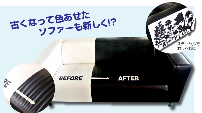
どちらにスプレーしたか 分からない程自然な仕上がり