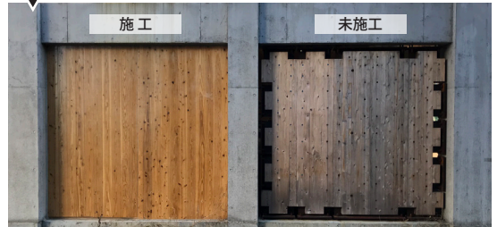
A 下塗り UV カットプライマー 上塗り DMD クリヤー

左面だけ施工を行い約半年経過観察を実施。 未施工(右面)の木材は色もあせ、黒くなって… 施工した左面は変わりなくきれいな状態を維持していました。