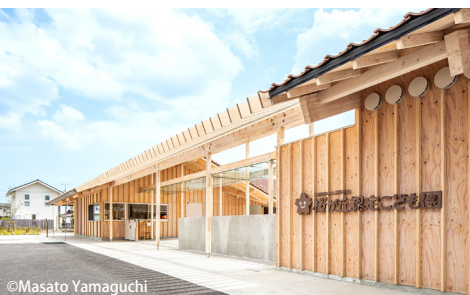
広島県西条市 / 桜が丘認定こども園