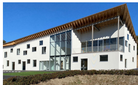
東京都町田市 / FC 町田ゼルビアクラブハウス