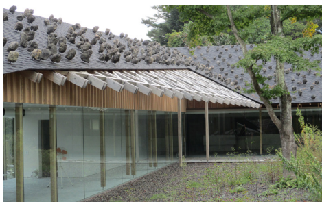
長野県軽井沢町 / ミシェルプラス軽井沢