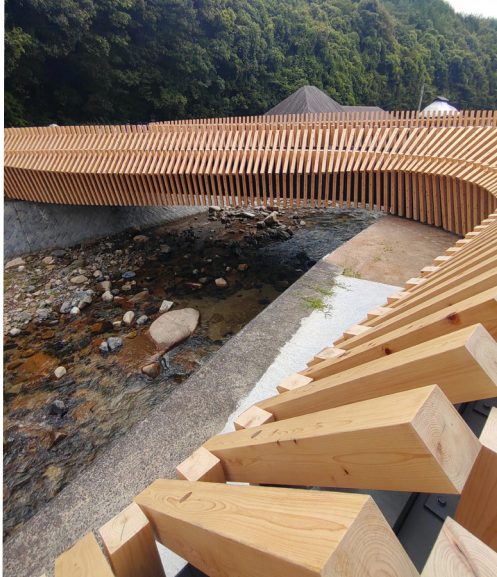
山口県岩国市 / 久杉橋