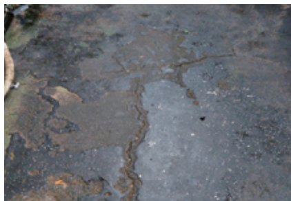
(例) 旧塗膜・汚れがある