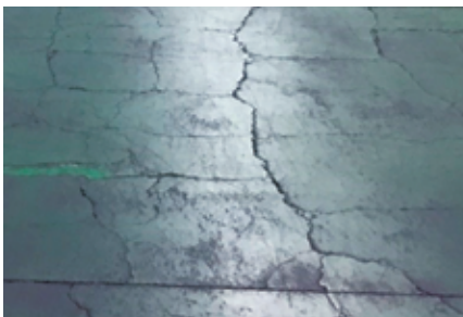
(例) クラックがある