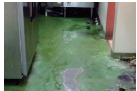
(例) 冷蔵庫・冷凍庫付近