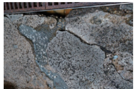
(例) 不陸箇所がある