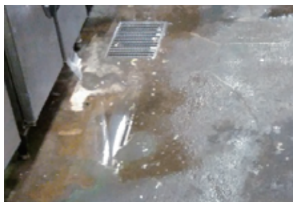
(例) 水溜まりがある