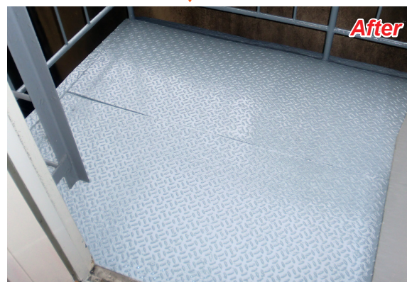
※パワー防錆 EP039塗布後、パワー防錆 AP089で塗装したものです